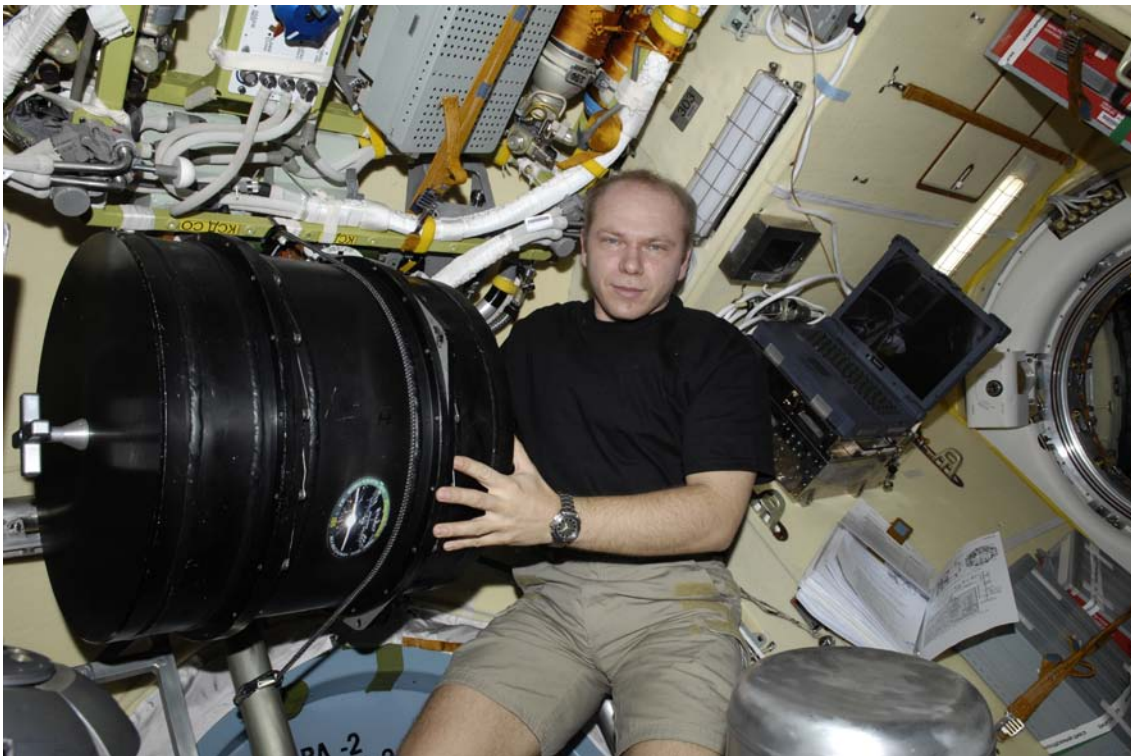
Abbildung 1: Kosmonaut Oleg Kotov mit dem PK-3 Plus-Labor in MIM-2, dem neuen russischen Docking- und Forschungsmodul, nach dem Aufbau der Experimentapparatur (vorne, in schwarzer Tonne) und des Kontroll-Computers (hinter dem Kosmonauten).

Drei Aggregatzustände der Materie sind jedem bekannt: fest, flüssig oder gasförmig. In unserem Universum dominiert mit 99 Prozent aber ein vierter Zustand: das Plasma. Dieser bildet sich, wenn Gas so stark erhitzt wird, dass sich seine Moleküle in Ionen und freie Elektronen aufspalten. Man könnte deshalb denken, dass ein Plasma besonders ungeordnet ist. Forscher am Max-Planck-Institut für extraterrestrische Physik (MPE) haben aber herausgefunden, dass sogenannte „Komplexe“ Plasmen unter besonderen Bedingungen flüssig werden können oder sogar kristallisieren. In diesem Zustand ermöglichen sie ganz neue Einblicke in die Physik von Flüssigkeiten oder Festkörpern. Die Plasmaphysiker können so beispielsweise das Schmelzen und Erstarren (die Kristallisation), die Gitter-Defektbewegung in Kristallen, oder Flüssigkeitseffekte auf der Basis einzelner Atome beobachten.